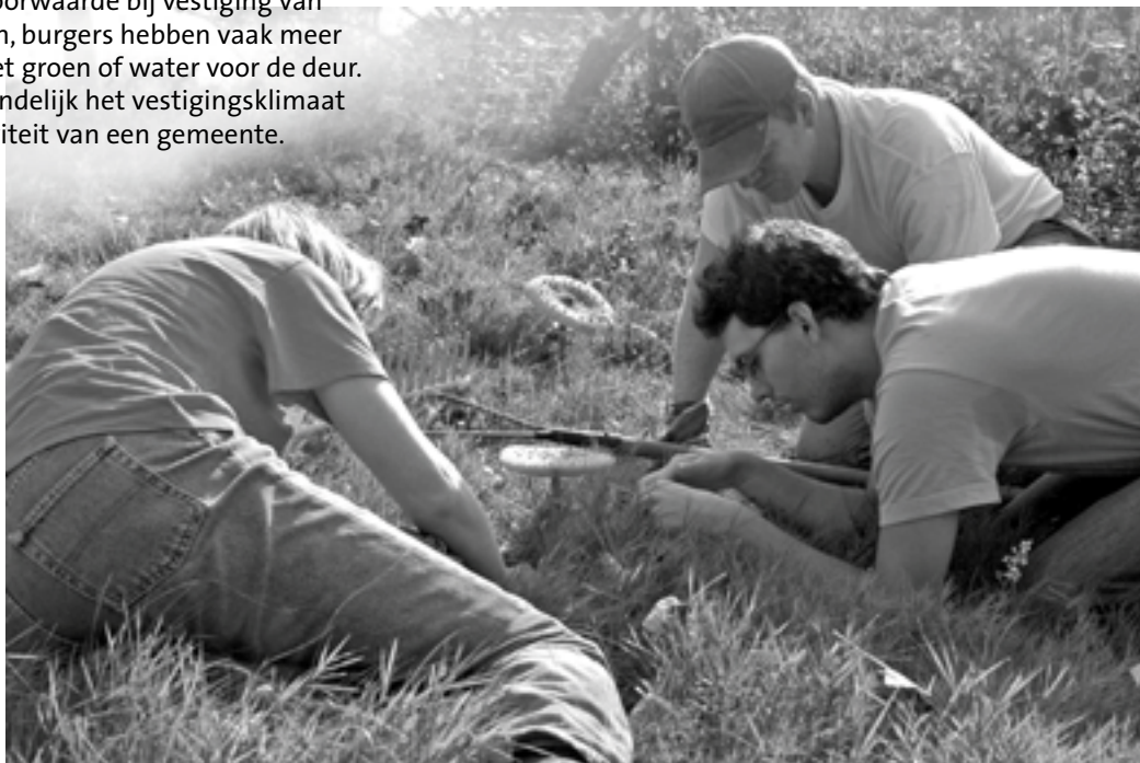
Koeheide Werkdag

Indien Vlaanderen zijn landschappen en de biodiversiteit wil behouden, zal ook in het landbouwgebied een algemene natuurbasiskwaliteit aanwezig moeten zijn. Concreet betekent dat de beperking van de vervuiling van grond, water en lucht door landbouwactiviteiten, de handhaving van een minimum aan permanente natuurinfrastructuur (o.a. kleine landschapselementen), en tijdelijke resultaatgerichte maatregelen voor de buffering (bv erosiestroken) en het behoud van soorten (bijvoorbeeld akkerreservaten voor akkervogels). Zo kan het landschap zijn functies blijven vervullen: landbouw, maar ook streekidentiteit, biodiversiteit en recreatie. Landelijke gemeentebesturen kunnen een belangrijke rol spelen in dit bewustwordingsproces en gepaste maatregelen nemen om ook in het agrarisch gebied een basiskwaliteit te garanderen.