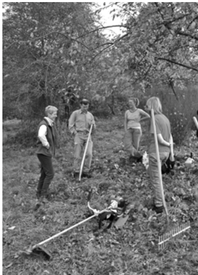
Koeheide werkdag

Via de regionale landschappen worden ook de andere gebruikers van de open ruimte aangesproken en gemotiveerd naar initiatieven voor natuur, zoals bv. de diverse poelenprojecten, haagplantacties, hoogstamboomgaarden, beheersovereenkomsten.