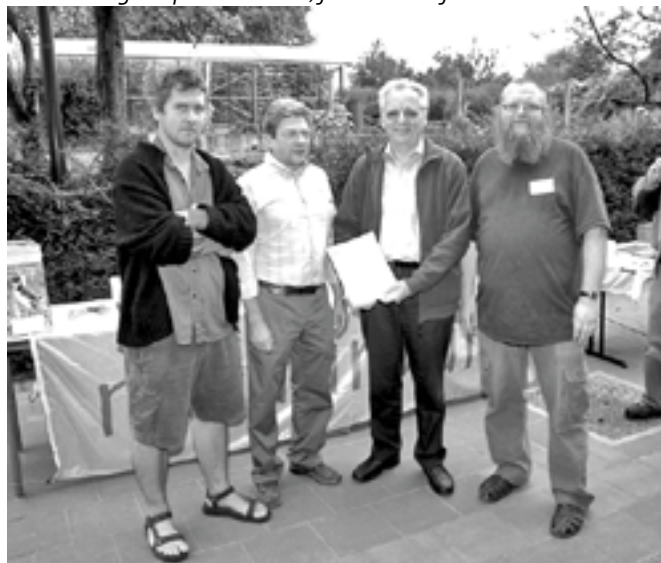
Koeheidedag 9 september 2007

De gemeente moet kansen geven aan vrijwilligers en groepen om het beleid mee vorm te geven en acties uit te voeren. Want een beleid op het veld realiseren, gebeurt best met de betrokkenheid en zelfs de inzet van zoveel mogelijk inwoners. Mensen kunnen individueel of georganiseerd (bv. via verenigingen) worden aangesproken. Uiteraard zijn de afdelingen van Natuurpunt hierin een vooraanstaande partij. Ook de sensibilisatie en de educatie rond bijvoorbeeld een geadopteerde soort valt onder Natuur voor iedereen.