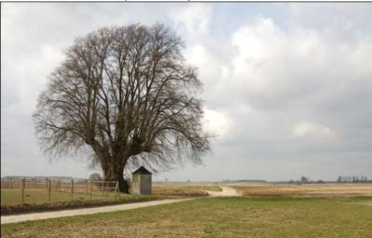
De linde en de kapel.

Wegens de belangen die hier in het geding zijn, vatten we de voornaamste argumenten die we aan de Deputatie hebben overgemaakt en die volgens Natuurpunt belangrijk zijn nog eens samen.