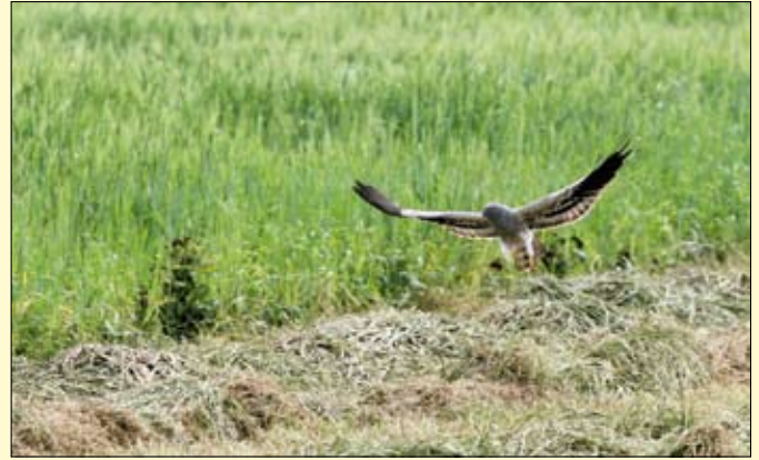
Grauwe kiekendief.