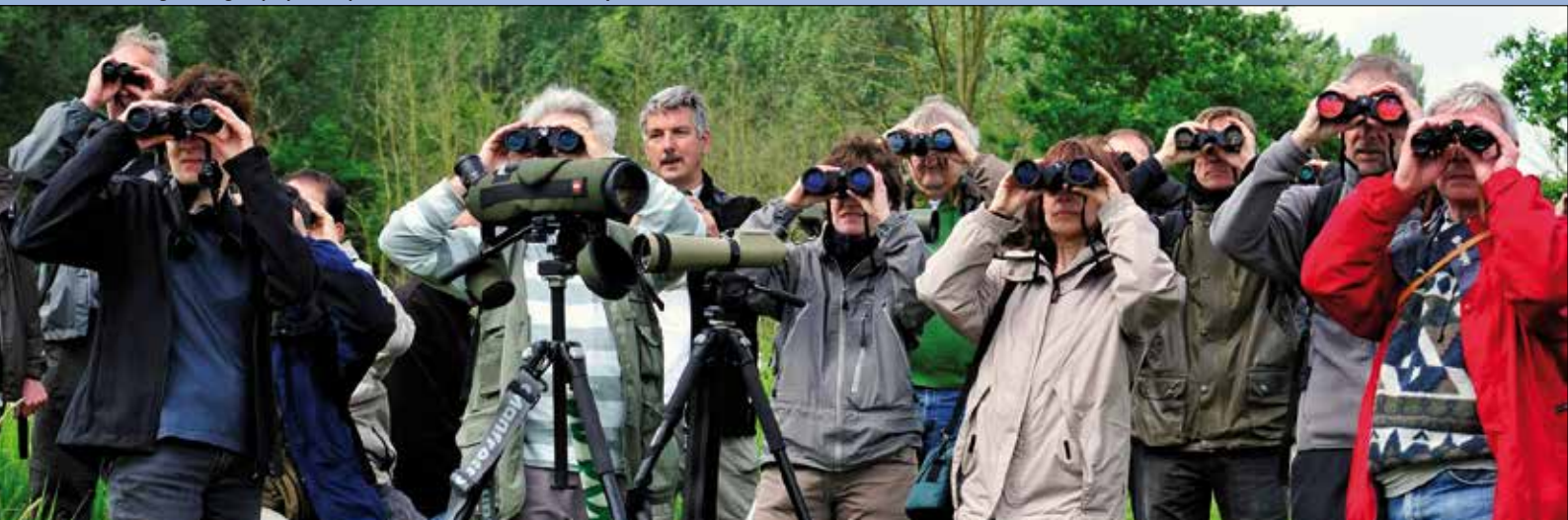
De Vogelwerkgroep op uitstap in Het Vinne.

Naast de tochtjes van meestal een halve dag in eigen streek, houden we vrijwel maandelijks een daguitstap naar verdere natuurgebieden, soms met de bus. Tijdens één van die busreizen met 50 deelnemers naar de Oostvaardersplassen in Nederland stelden we daar de aanwezigheid vast van een Eleonora's valk, de enige tot nu aanvaarde waarneming van die soort in de Benelux. Niemand anders dan wij 50 kregen die valk in de kijker. Wij