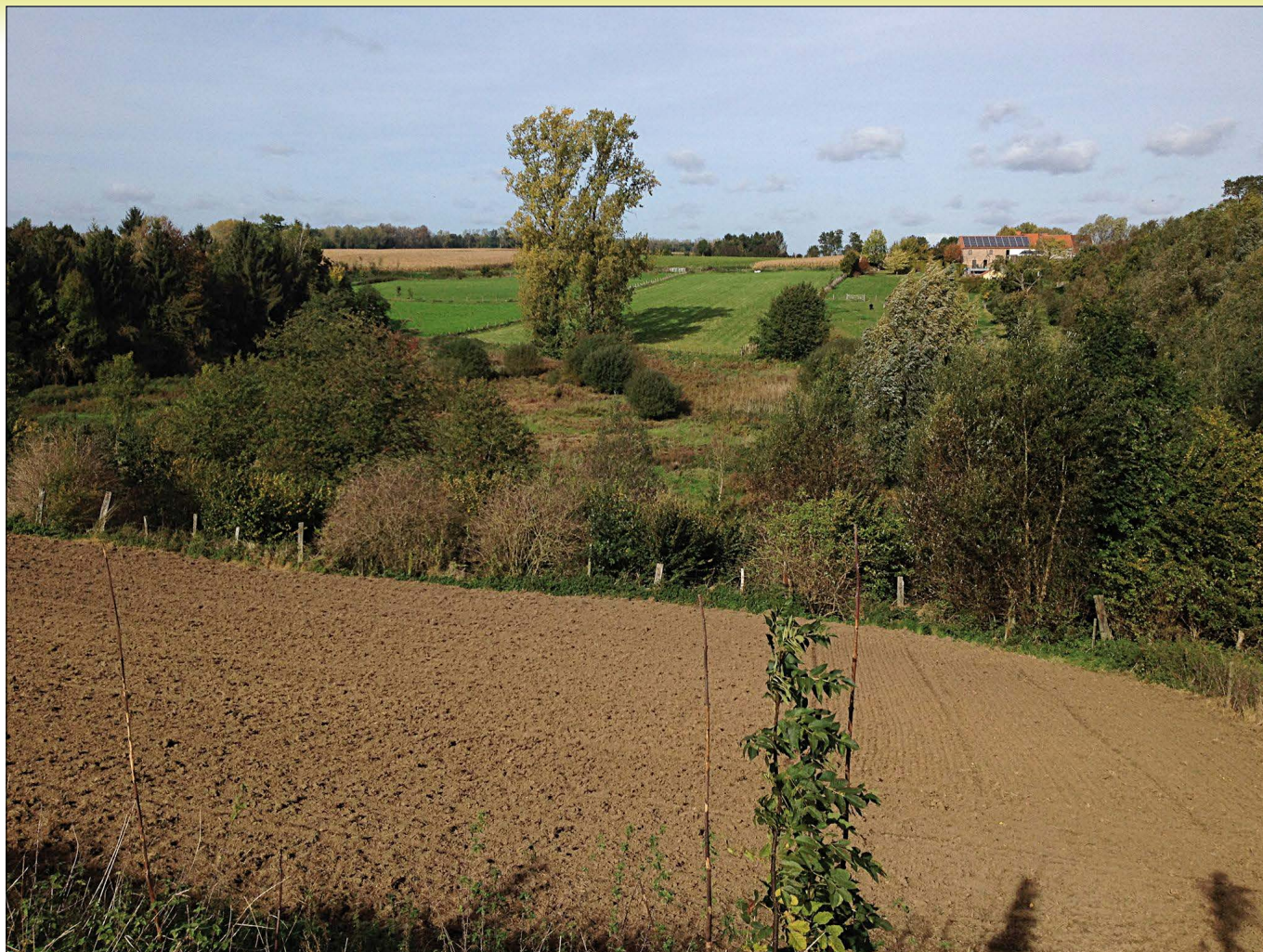
Schil contrast tussen het omgeploegde historische grasland op de voorgrond en het aangrenzende beheerde Natuurgebied vol biodiversiteit in de vallei (Hoksem, Hoegaarden).

Die natuurgebieden vragen nu om afronding tot samenhangende grote complexen in een omvattend valleisysteem met een ongestoorde waterhuishouding, herstel van de hydrologische condities en ruimte voor de rivier. Zo kan de vallei terug optimaal functioneren, en dat ten voordele van de biodiversiteit, de natuurbeleving en als klimaatbuffer. Dus optimaal gericht op het verlenen van diensten aan de samenleving en aan iedereen.