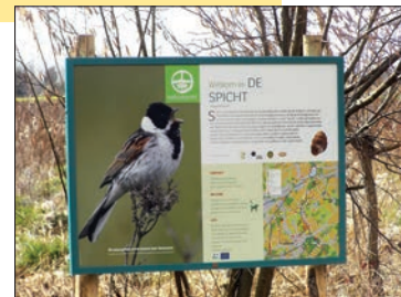
Welkom in De Spicht.