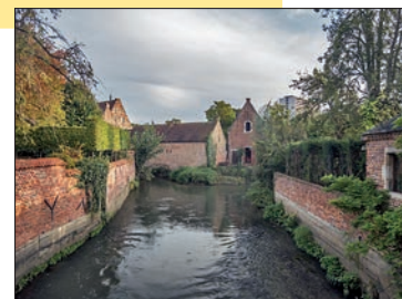
De Dijle in Leuven.