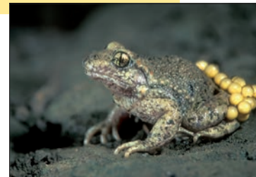
Vroedmeesterpad.