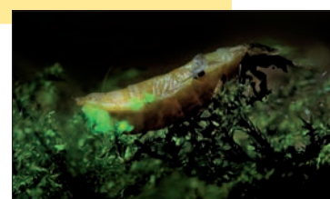
Kleine glimworm.

Tip: parkeren op de carpoolparking van Rommersom