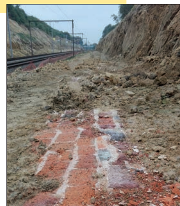
Restanten van de verdwenen tunnel.

Info: Sophie Coremans, 0470 63 04 38, raoul.melis@scarlet.be of Pieter Abts, pieter.abts@natuurpunt.be