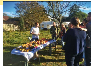
Boomgaardfeest in Roosbeek.