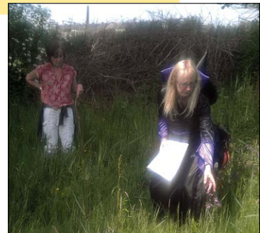
Het uur van de heks.

Info: Magda Roosbeek en Luc Nagels, 0495 33 42 09, lucagraaf@telenet.be