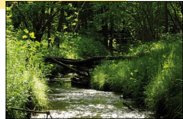
De Molenbeek in Koebos.