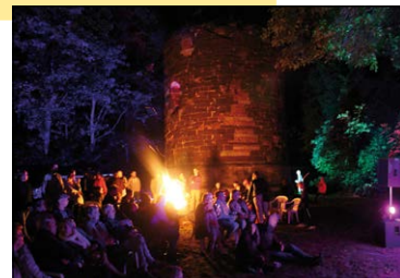
Dag van de Molenberg 2017, kampvuur.