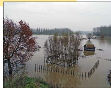
Waterberg in Diest, Webbekomsbroek.

Inschrijven: tot 10 september bij Saskia, berglinden@qsources.be of 0478 96 01 71