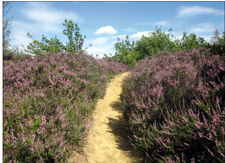
's Hertogenheide.

Op zondag 4 november 2018 organiseren de Hertogelijke Aarschotse Kring voor Heemkunde, de Aarschotse Gidsenbond en Natuurpunt Oost-Brabant-Afdeling Aarschot een namiddag die in het teken staat van de sporen die de familie Arenberg heeft nagelaten in en rond de stad Aarschot.