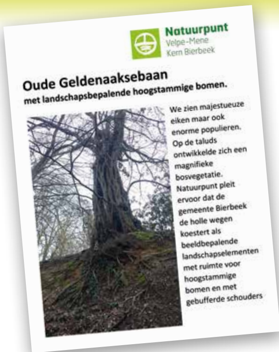
■ Pancarte met uitleg op het uitgestippelde wandelcircuit van Natuurpunt Bierbeek