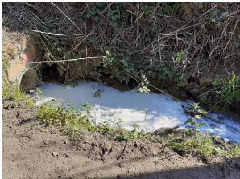
■ Dit water moet opgevangen worden in de mestkelder, maar ongestraft in het oppervlaktewater lozen is veel goedkoper!