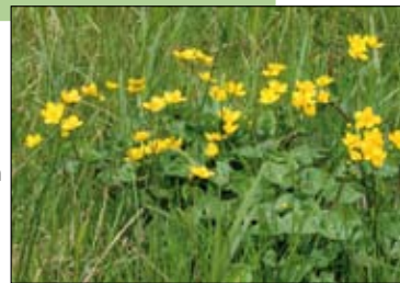
Vorsdonkbos in de lente.

Info: Erwin Rooms, 016 56 59 18, Erwinrooms@skynet.be