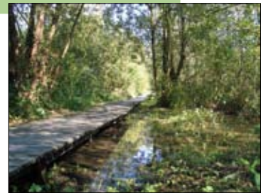
Natuur in Herent

Info: www.natuurpunt-herent.be of Lies.Natuurpuntherent@gmail.com