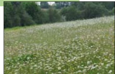
Rosdel Meiveld.