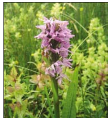
Brede orchis.

Info: Peter Pelegrin, 0496 42 81 91, peter.pelegrin@telenet.be