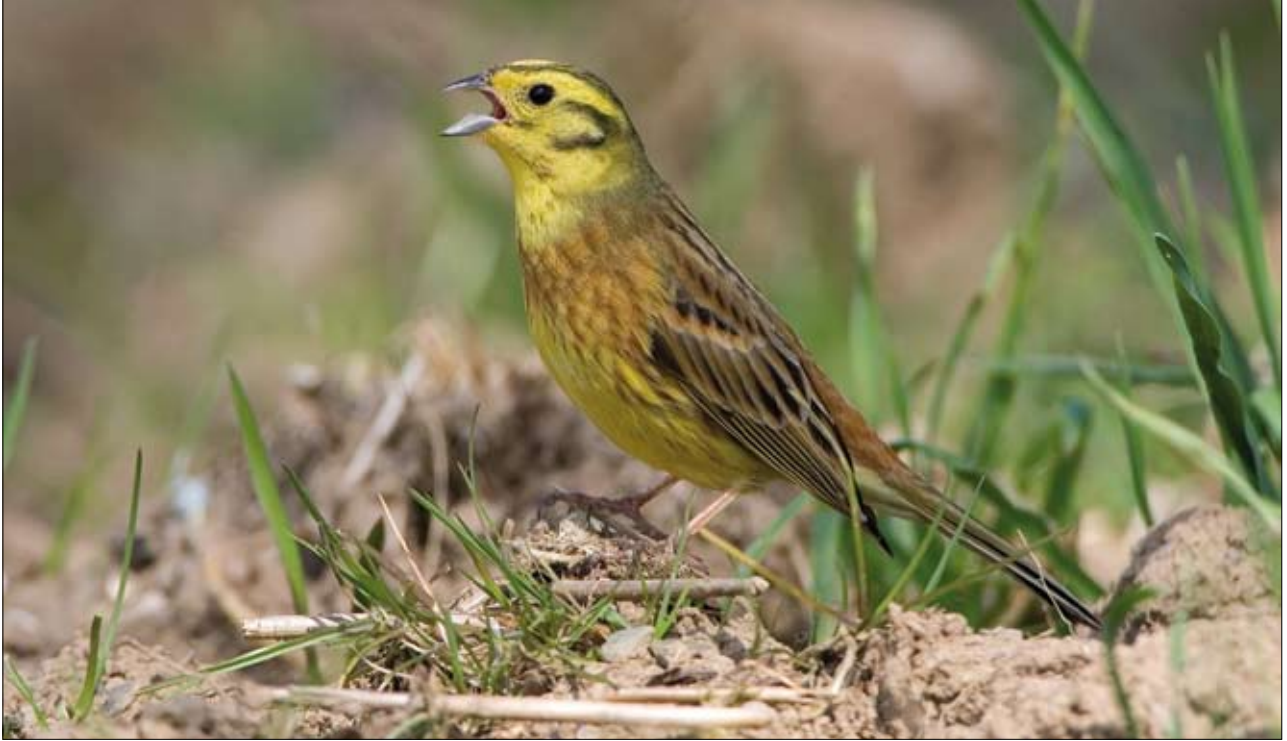
Geelgors, kensoort van natuur in het agrarisch landschap.