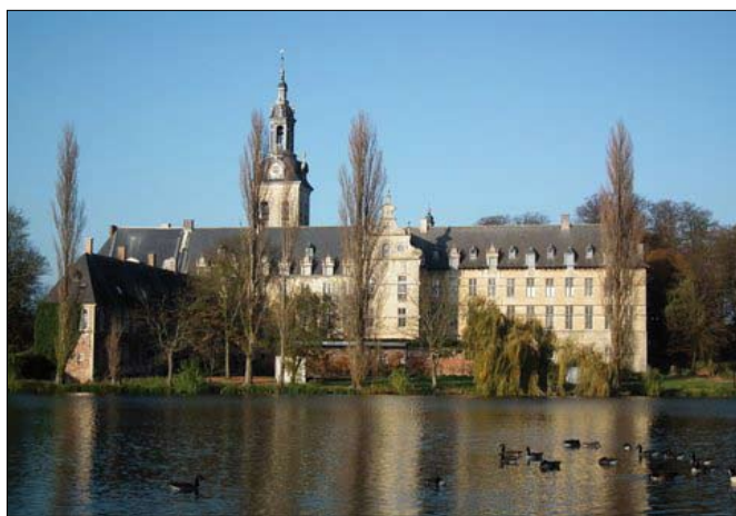
Abdij van Park, Europees erfgoed als kader voor de Walk for Nature 2012.