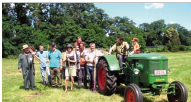
Maaievening 2012.

Belangrijk daarbij is de inzet van vrijwilligers. Op deze manier vergroten we de draagkracht van het abdijproject, op deze manier geven we ook de mens een plaats in dit cultuurlandschap. De Vrienden onderhouden een pracht van een kruidentuin, twee hoogstamboomgaarden met oude rassen, kleinfruit en druiven. Onze abdij-imker draagt zorg voor de bijenstand van de Provincie Vlaams-Brabant. Vleermuizen vinden een onderkomen in een vleermuiskelder. De vijvers worden ecologisch beheerd. Aan de ingang van de abdij ontfermen we ons over een moerasgebied en we doen aan hooilandbeheer tijdens ons onvolprezen maaievening (tweede weekend van juli). We organiseren geleide wandelingen en lezingen in de abdij.