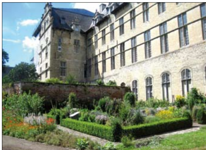
Kruidentuin Parkabdij.

Vandaag geldt de Abdij van Park als één van de best bewaarde Ancien Regime-abdijcomplexen in West-Europa. Sinds de bouw van de kerktoeren in 1730 werd er weinig of niets aan het geheel toegevoegd, en belangrijker, verdwenen er ook geen onderdelen. Recent gaven de norbertijnen het volledige abdijcomplex voor 99 jaar in erfpacht aan de stad Leuven. Dankzij een uitzonderlijke