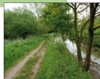
Laekdal te Tremelo.