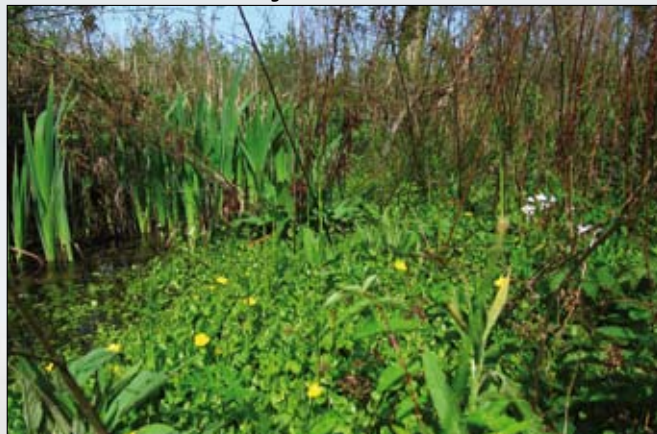
Hersteld elzenbroek en natte ruigten in Aronst Hoek.

Tien jaar geleden startte de uitbouw van het complex Aronst Hoek/Melsterbeek. Dit project alleen al is uitgegroeid tot een 230 ha en vormt de wissel op een toekomst voor robuuste natuur. Als we nu de nodige middelen vinden, kunnen we belangrijke puzzelstukken in de grote puzzel leggen en een sprong vooruit maken naar forse en duurzame riviernatuur. We werken beetje bij beetje, puzzelstukje na puzzelstukje zodat we uiteindelijk één groot rivierpark De Gete kunnen realiseren. Nu liggen dus de kansen voor. Of we ze kunnen invullen, zal afhangen van de fondsenwerving op regionale schaal voor het project. De Getevallei is vrij dun bevolkt zodat we voor de realisatie van dit project een beroep willen doen op de solidariteit en vrijgevigheid van alle natuurbeschermers in het arrondissement Leuven. Er zijn mogelijkheden voor een 100-tal ha extra natuur waardoor wat er al is een stuk robuuster en homogener kan worden en het riviersysteem beter kan functioneren.