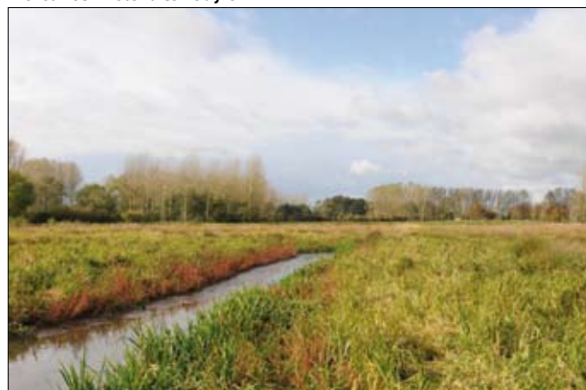
Aronst Hoek.

natuurgebied van Vlaams-Brabant en dagelijks groeit het nog aan. Het afgelopen jaar is er hier 30 ha extra natuurgebied veilig gesteld. Kansen liggen voor om nu de puzzel verder in elkaar te steken en te komen tot aaneengesloten blokken waar ruimte kan gegeven worden aan natuur en aan de rivier. Kortom waar de fundamenten voor een echt rivierpark De Gete kunnen gelegd worden.