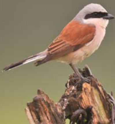
Grauwe klauwier.

Bijdrage te storten op rekening IBAN BE66 2930 2120 7588 van Natuurpunt Beheer, Coxiestraat 11, 2800 Mechelen, met vermelding 'project 9414 ARONST HOEK'.