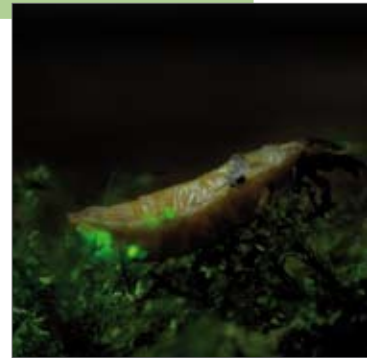
Kleine glimworm.

Info: Roland Grugeon, 0472 21 28 70, roland.grugeon@telenet.be