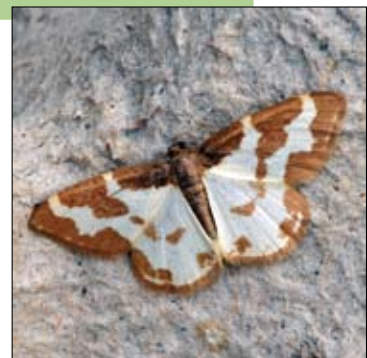
Gerande spanner.

Info: Hans Marijns, 0473 73 03 10, info@natuurpuntboortmeerbeek.be