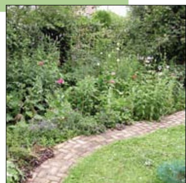
Natuur in de tuin.