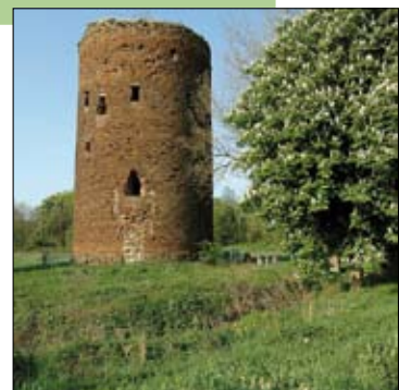
De Maagdentoren in Zichem.

Info: Manu Vlaeyens, 0473 94 16 08 of Wim Janssens, 0478 21 53 10