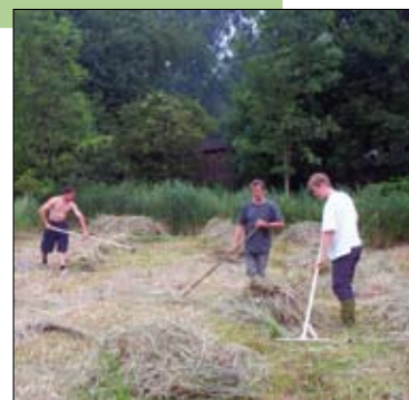
Vrijwilligers natuurbeheer.

Contact: Raf Ghijsen, 0486 09 85 00, ghijsen.janssens@scarlet.com