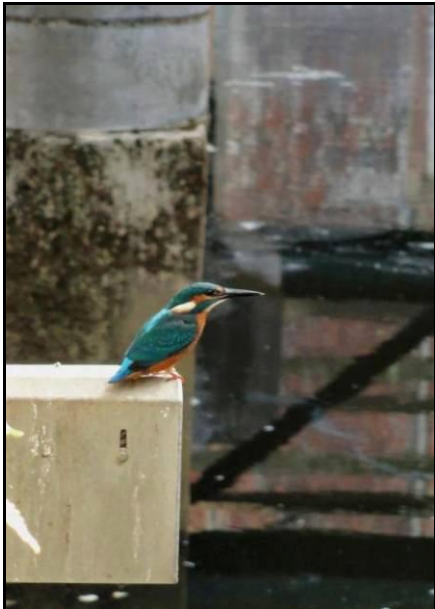
De Isvogel... ook in de binnenstad.