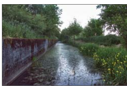
Antitankgracht, Haacht.