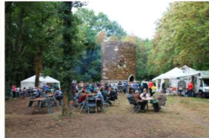
ZATERDAG 23 september 2017: Dag van de Molenberg