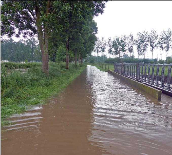
Overstroming ten gevolge van extreme zomerse neerslag in 2016.

Als gevolg van de opwarming zullen steeds vaker extreme hoeveelheden neerslag zorgen voor overstromingen. Ook langere perioden van droogte zullen toenemen.