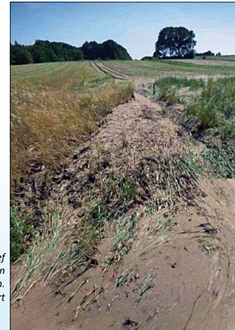
Erosie vanuit intensief bewerkte akkers: een groot probleem.

Wat daarentegen nodig is, is een totaalaanpak: meer ruimte voor de rivier en waterberging en natuur over de hele vallei en de hele gradiënt en niet hier en daar gestapeld en geconcentreerd in een compartimentje waar een reservaat gelegen is.