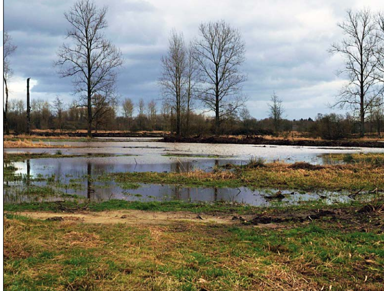
In het Natuurgebied De Demerbroeken mag de rivier nog overstromen.

De natuurlijke waterberging is in Vlaanderen sterk achteruit gegaan door de constante toename van verharde oppervlakte. Bovendien zijn de meeste waterlopen recht getrokken of 'genormaliseerd', de valleigebieden gedraineerd voor de intensieve landbouw en is de natuurlijke plantengroei die water kan ophouden en absorberen, verdwenen. Rivieren recht trekken om het water sneller af te voeren en steeds hogere dijken maken, zorgen enkel voor meer wateroverlast en modderstromen in steden en dorpen stroomafwaarts.